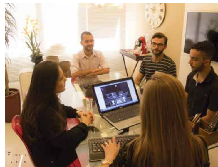
ÉQUIPE DO ESCRITÓRIO